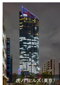
虎ノ門ヒルズ(東京)