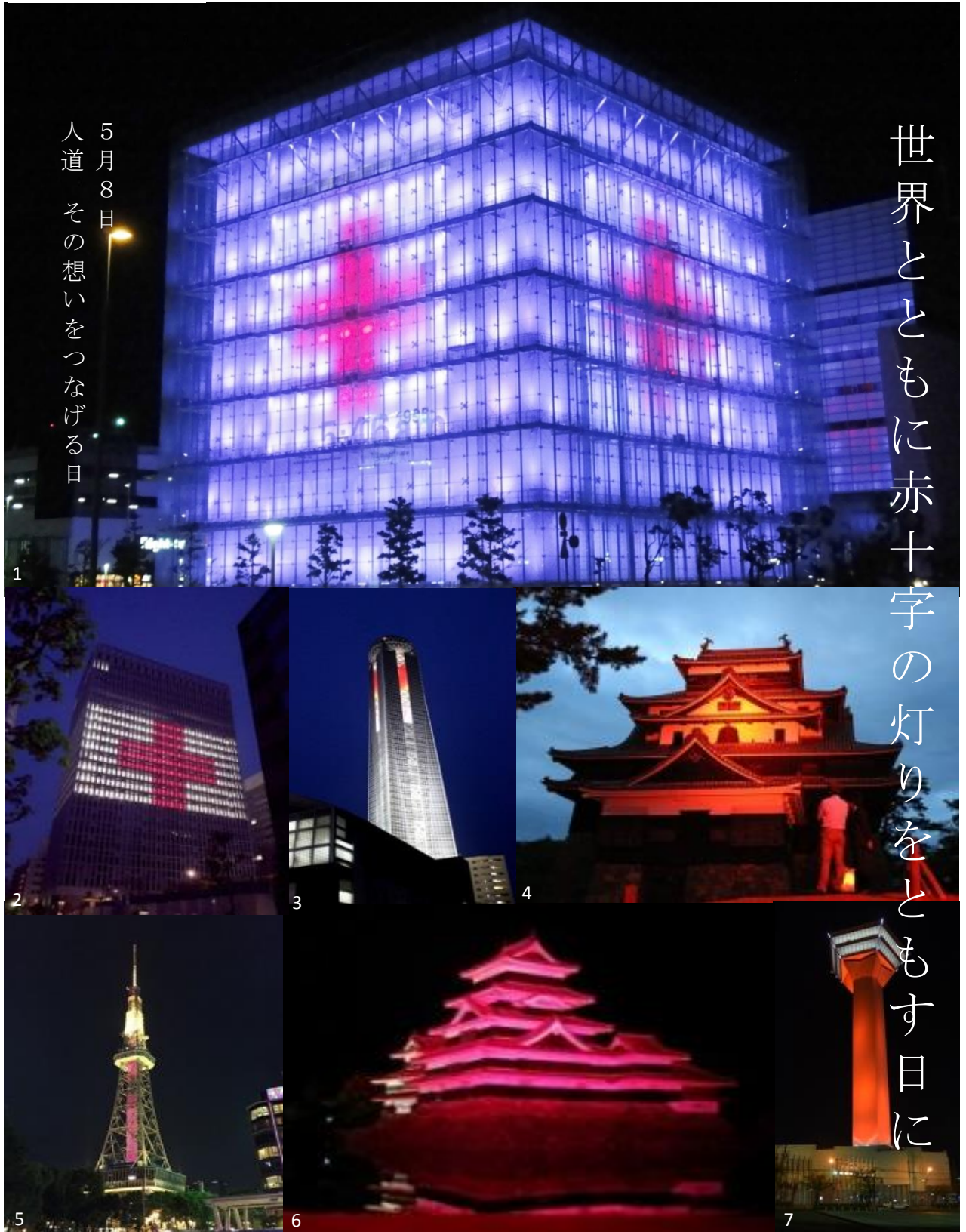
1 阪神・淡路大震災記念「人と防災未来センター」(兵庫) 2 清水建設(東京) 3 下関市海峡ゆめタワー(山口) 4 松江城(島根) 5 名古屋テレビ塔(愛知) 6 松本城(長野) 7 五稜郭タワー(北海道)